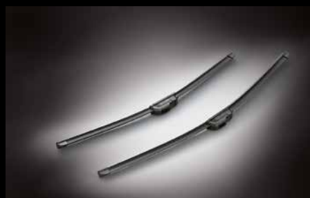
26 | Premiumscheibenwischersatz

Der Zusatzstecker wird zum Zigarettenanzünder.