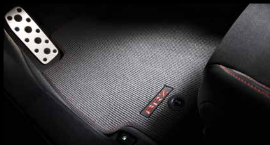
21 | Teppichmattensatz vorne & hinten (Rot, Silber, Blau)