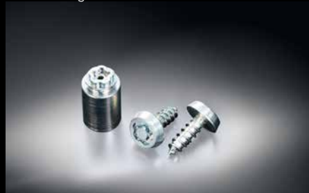
32 | Navigationsschlossschraubensatz

5,8" Touchscreen, intuitive "Click & Slide" Bedienung, Navigation (Europa), TMC, Bluetooth, Anschlussmöglichkeiten für eigene Musikplayer und Mobiltelefone. *Einbaumaterial und SD-Karte zusätzlich notwendig.