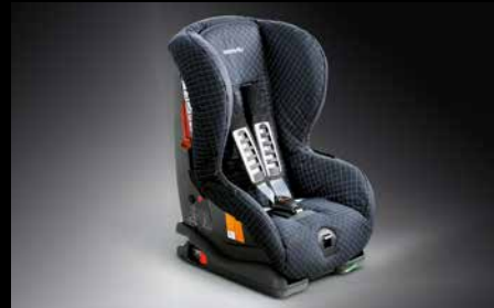
33 | Kindersitz Duo ISOFIX Plus

Schutz vor Diebstahl. Die Spezialschrauben können nur mit dem codierten Adapter gelöst werden.