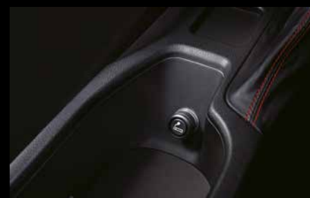
25 | Zigarettenanzünder-Kit

Praktisch herausnehmbarer Aschenbecher für den Getränkehalter in der Mittelkonsole.