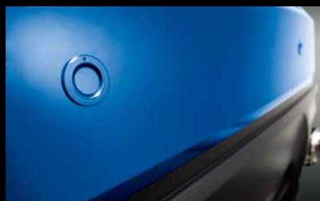
28 | Ultraschalleinparkhilfe hinten