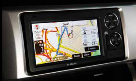
31 | SD-Karten Navigationssystem

Xenon- und LED-Leuchtmittel nicht enthalten. Inhalt kann von der Abbildung abweichen.