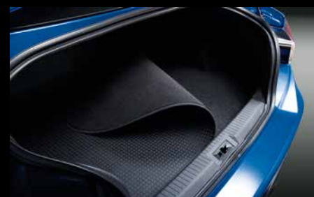
23 | Kofferraummatte

Sportliche Zierleisten (Set mit 2 Stück) in Carbonoptik mit BRZ Logo, um den Türeinstiegsbereich aufzuwerten.