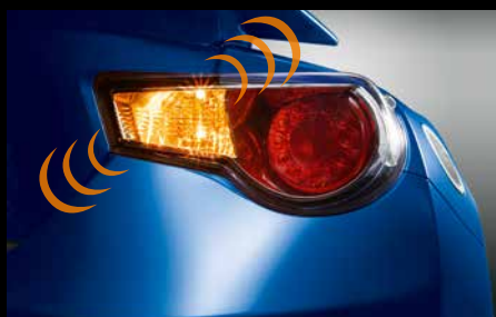
29 | Komfort Blinkmodul mit Notfallwarnblinkfunktion

Sicheres Einparken nach hinten mit 4 Sensoren. Akustische Warnung.