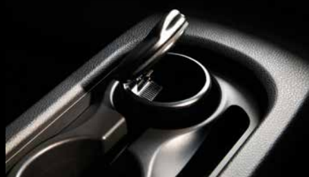
24 | Aschenbecher

Wendbare Matte mit Textil- und PVC-Seite zum Schutz des Kofferraums vor Verschmutzung.