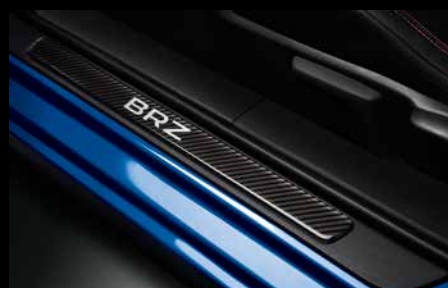
22 | Türeinstiegsleistensatz Carbonoptik