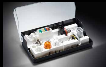
30 | ReserVELampenset

Bifunktionales Sicherheitselement: Die Blinker leuchten 4 Mal auf und die Warnblinkanlage wird bei einer Notbremsung aktiviert.