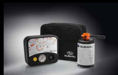
27 | Reifenpannenset

Aeroblades mit dynamischem Design (Set mit 2 Scheibenwischern) für bessere Performance.